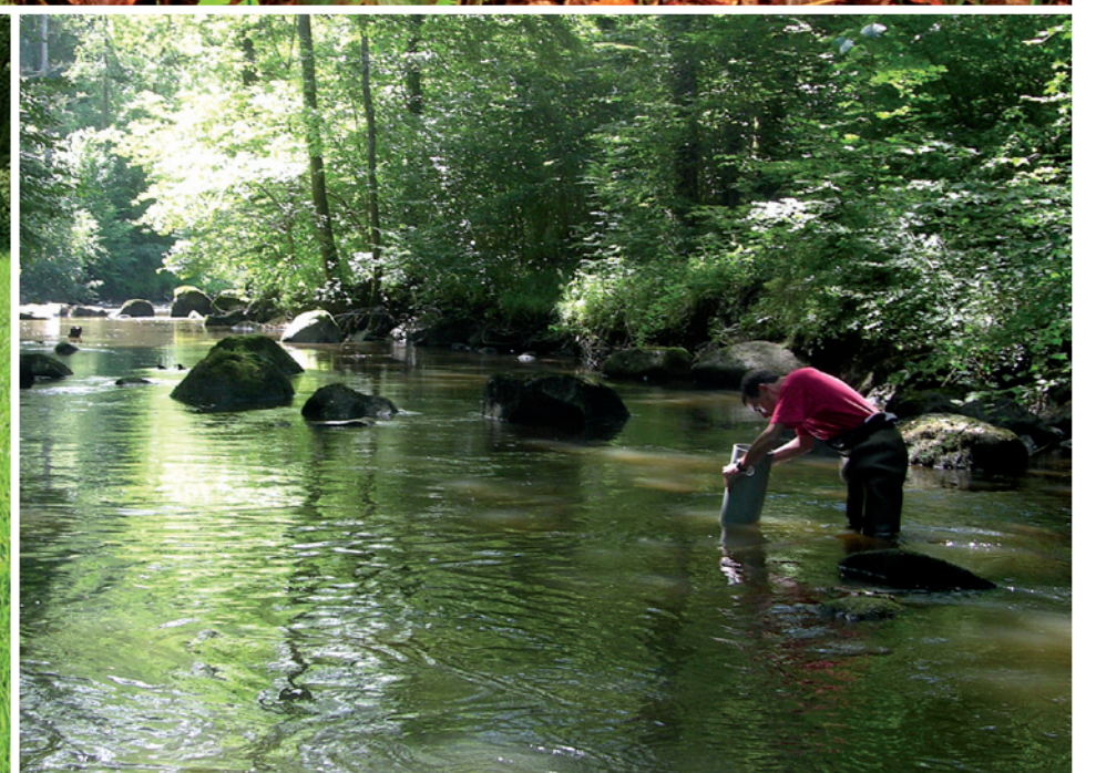
Des réintroductions sous contrôle