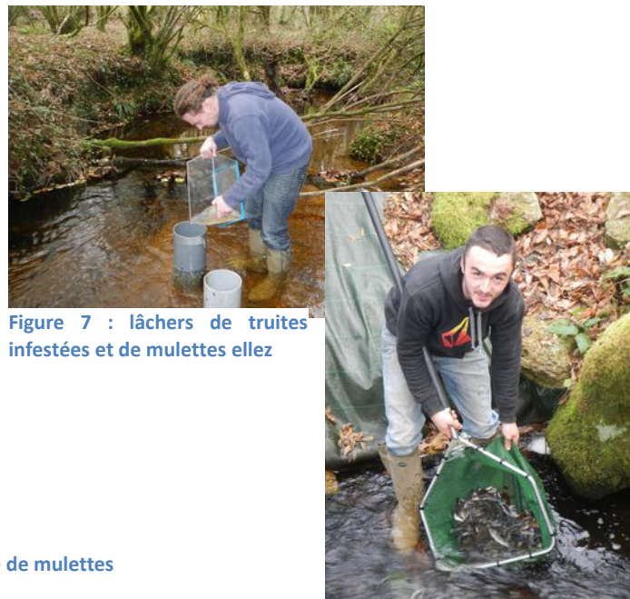
Figure 7 : lâchers de truites infestées et de mulettes elles