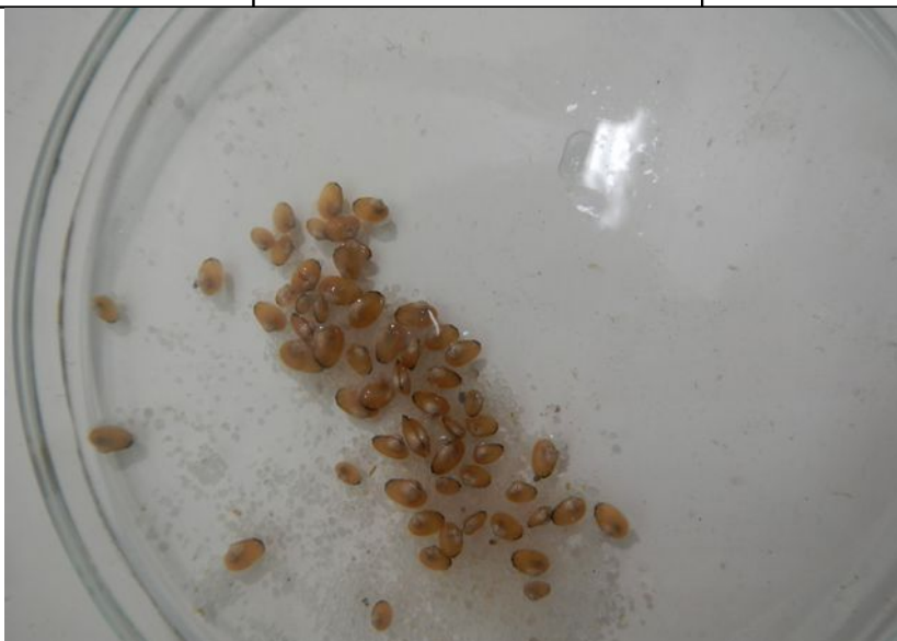
Figure 4 : comptage de mulettes