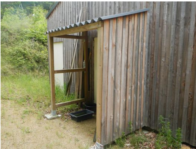
Figure 1 : SAS extérieur quarantaine

Enfin, la fédération de pêche après étude approfondie a décidé de changer le mode de tarification du bâtiment mulette. Pour cela, l'intervention d'une équipe mandatée par EDF a été nécessaire. Le mode de tarification choisi précédemment (tarif jaune) s'est avéré largement surdimensionné par rapport aux consommations réelles constatées sur l'exercice précédent. Ce changement (tarif bleu) permet de réaliser de réelles économies sur les factures mensuelles.