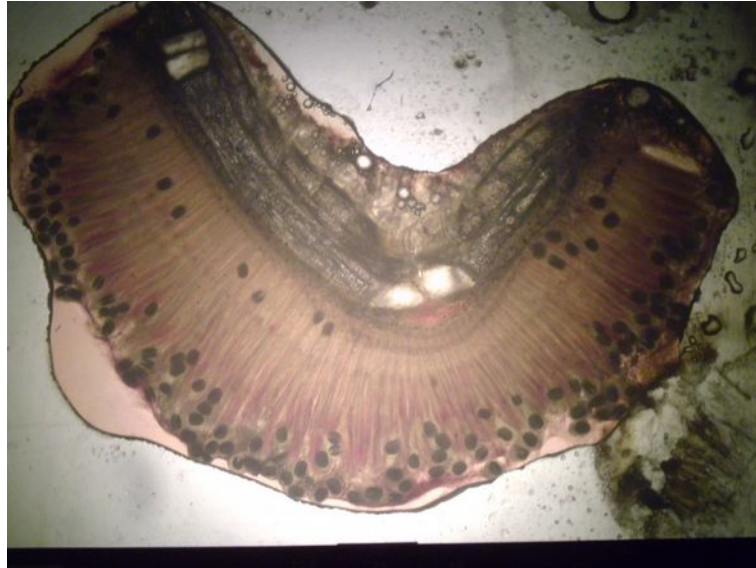
Figure 6 : comptage de mulettes enkystées

Pour chaque souche un lot de poissons était prêt à accueillir les larves de mulettes : truite fario. Des contrôles du nombre de glochidies présentes sur les branchies sont effectués régulièrement. Nous privilégions l'examen des poissons morts durant l'élevage plutôt que le sacrifice systématique d'individus.