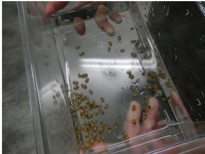
Figure 3 : mulettes en cours de changement d'auge