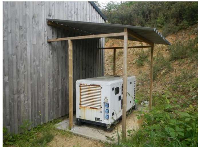
Figure 2 : abri groupe électrogène